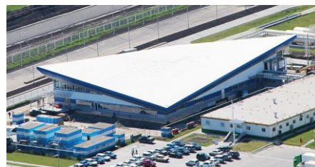
МАРС – 2,3 МЛРД РУБ.