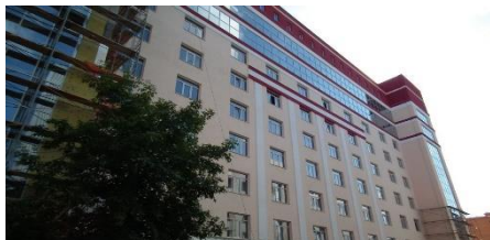
МЕДТЕХНОПАРК – 1,6 МЛРД РУБ.