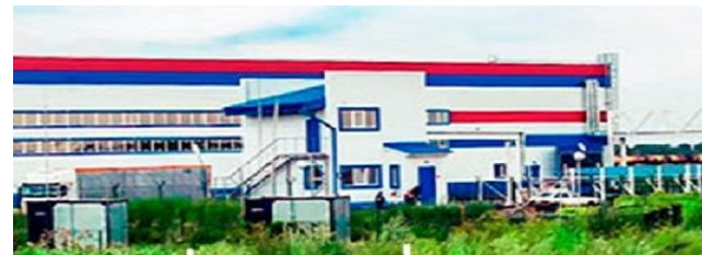
ЗТИ СИБИРЬ – 0,9 МЛРД РУБ.