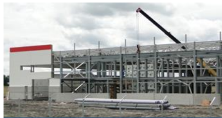
МОНДЭЛИС – 3,5 МЛРД РУБ.