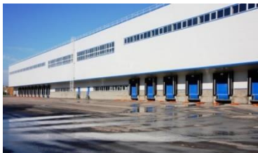
ПЛП – 2,5 МЛРД РУБ.