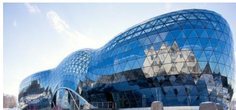
БИОТЕХНОПАРК – 1 МЛРД РУБ.