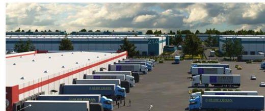
ВОСТОЧНЫЙ ПЛП – 0,9 МЛРД РУБ.