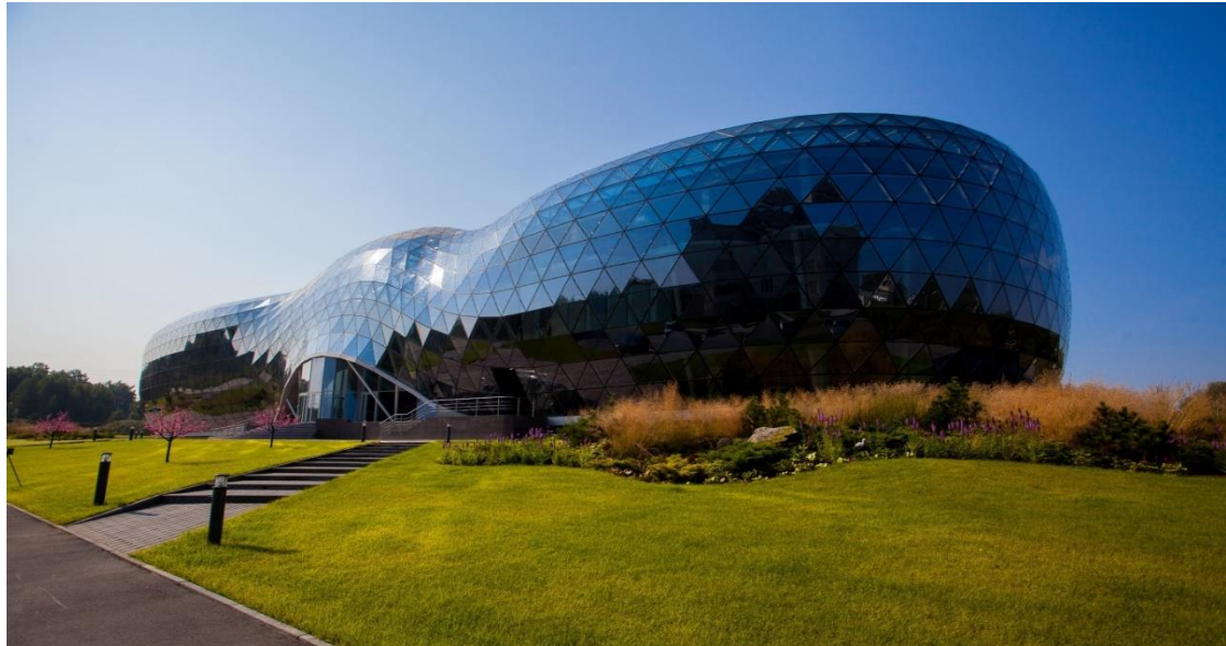
Центр коллективного пользования