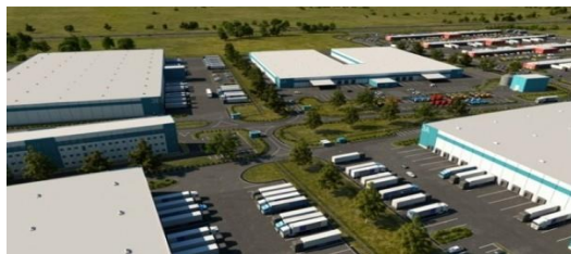
РУСАГРОМАРКЕТ – 6,9 МЛРД РУБ.