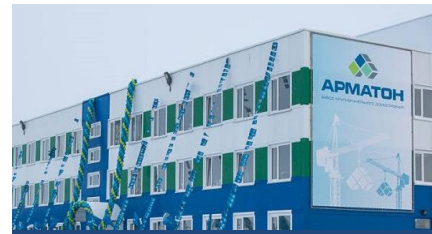
АРМАТОН – 1,6 МЛРД РУБ.