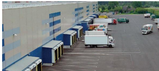
СКЛАДКОМПЛЕКС – 0,3 МЛРД РУБ.