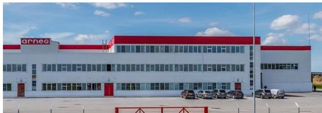
АРНЕГ – 0,7 МЛРД РУБ.